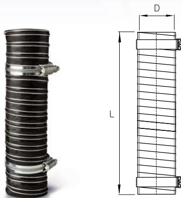
Dimensions \ Ingombri